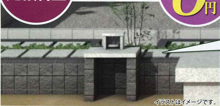
イラストはイメージです。